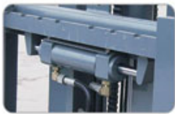
可安装侧移 Side Shift