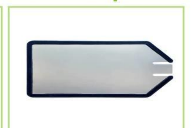
Placa de paciente de metal