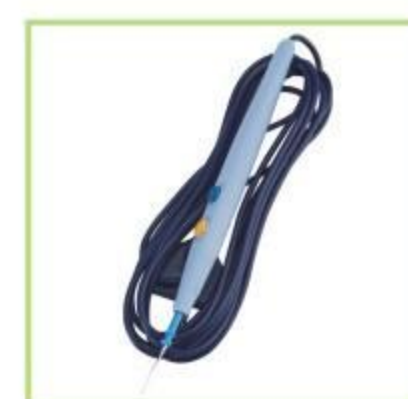
Electroquirúrgico con botón pulsador Lápiz