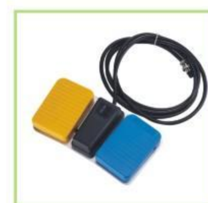
Interruptor de pie