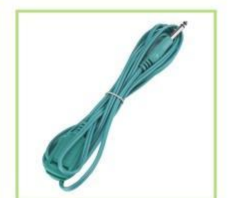
Cable de la placa del paciente