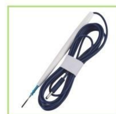
Electroquirúrgico con interruptor de pie