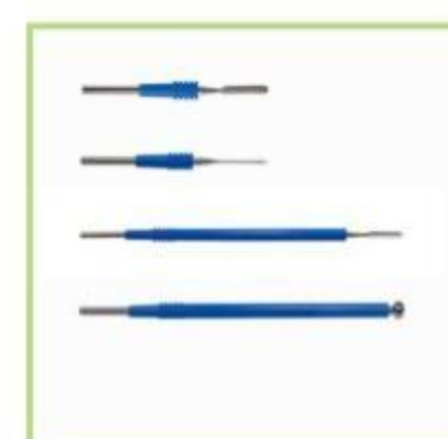
Electrodos estándar Lápiz