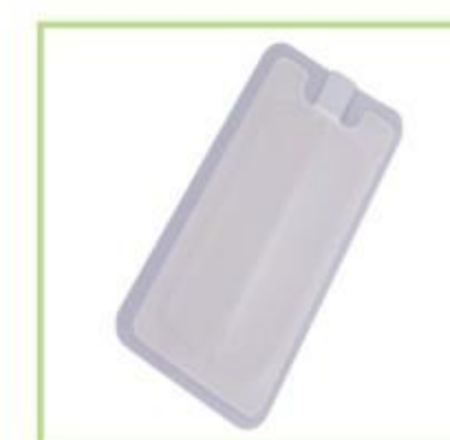
Almohadilla neutra bipolar desechable