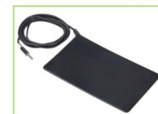
Placa de paciente de silicona